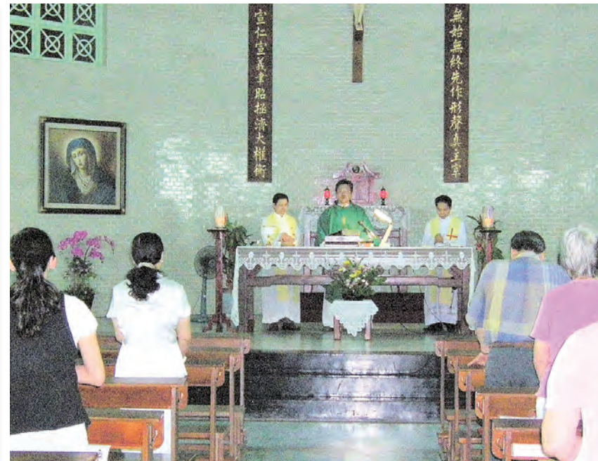
▲保祿年，我們克服萬難運送聖母與聖保祿兩幅大畫像，巡迴澎湖各堂及醫院診所。