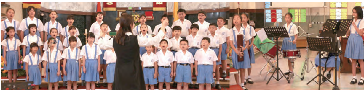
▲高年級組上智小學合唱團認真投入