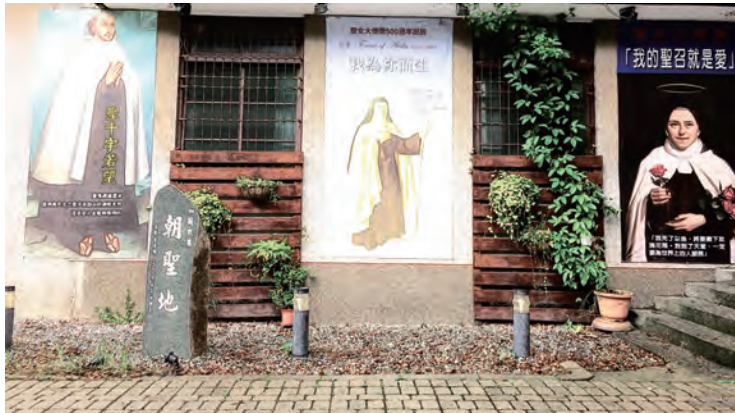
▲聖經講座第2站：新竹東南街加爾默羅聖母朝聖地。