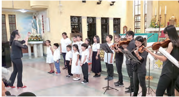
▲沙鹿天主堂的聖采琪聖詠團