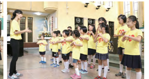
▲西屯天主堂瓜達魯貝聖詠團