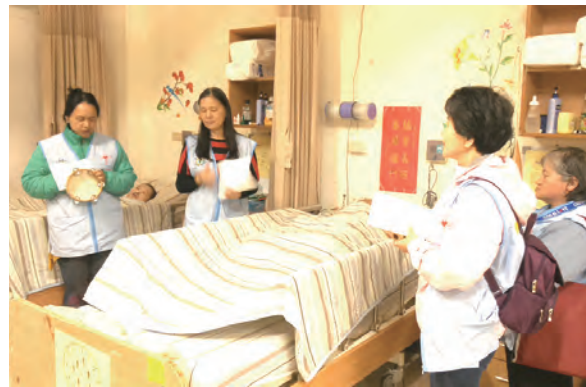
▲為臥床的住民祈禱，撫慰他們的心靈。