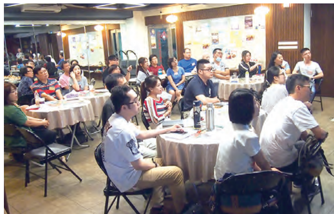
▲本次工作坊參加者37%屬孩童時領洗，63%為成人領洗。