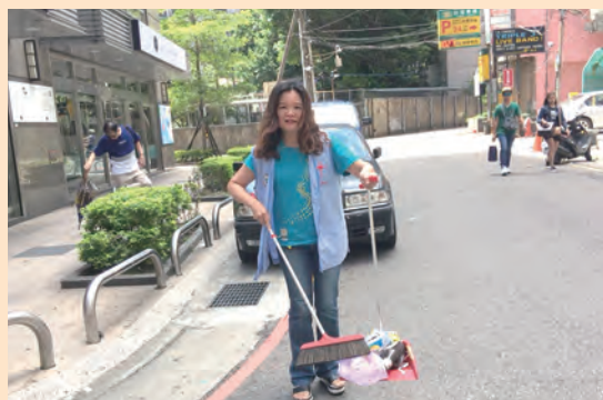
▲志工以專注打掃街道，傳揚天主的愛。