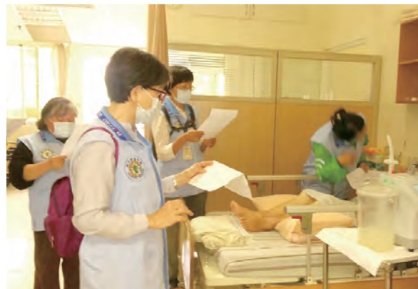
▲用心傾聽痛苦者的聲音。