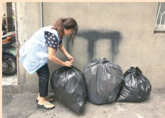
▲開心服務，樂做扛垃圾志工。