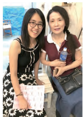
▲南松山天主堂的媽媽們，是大博爾青年的最佳後盾。