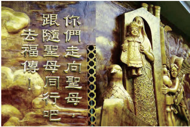
▲聖經講座第1站：苗栗洛雷托聖母之家朝聖地。