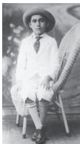
▲24歲在羅馬晉鐸，兩年之後在家鄉薩爾瓦多主禮首台彌撒。一生的寫照：「效法基督向貧困的人傳遞福音、向世人彰顯基督，成為司鐸是最好的方法。」 ▲出身於簡樸的教友世家，幼年即相當虔誠好學；父親希望他學習當木匠，但他卻渴望成為神父。

人員與主教，再也沒有神職人員，唯獨你們生還，那麼你們每個人都要成為天主的麥克風，每個人都要成為祂的信差和先知。」