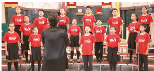
▲高年級組主教座堂小天使合唱團訓練有素