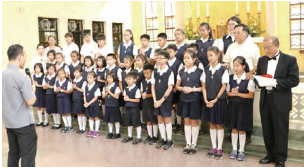
▲台中教區兒童聖歌歌唱代表隊派遣禮