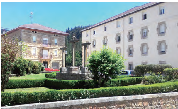
▲仁慈聖母傳教會在伯利斯小鎮的母院

伯利斯仁慈聖母傳教會於今年7月13日至8月9日，在西班牙北部伯利斯小鎮的母院，召開了第16屆總會議。為這次總會議，修會從2015年9月開始準備。藉著持續培育的方式，邀請姊妹們從個人、