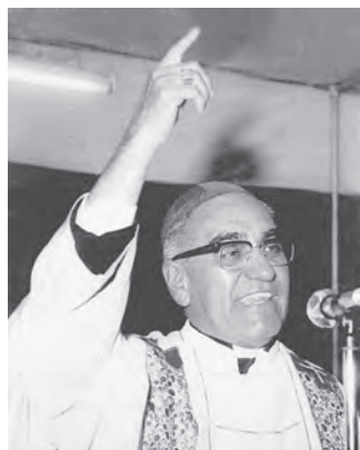
▲羅梅洛總主教善用媒體宣講福音、勸人悔改。