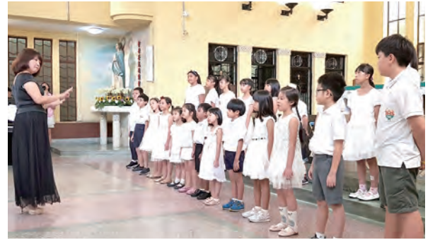
▲第一總鐸區的主愛聖詠團