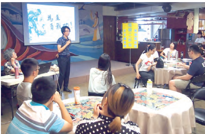
▲青年分享福傳經驗及給自己每年的福傳目標。