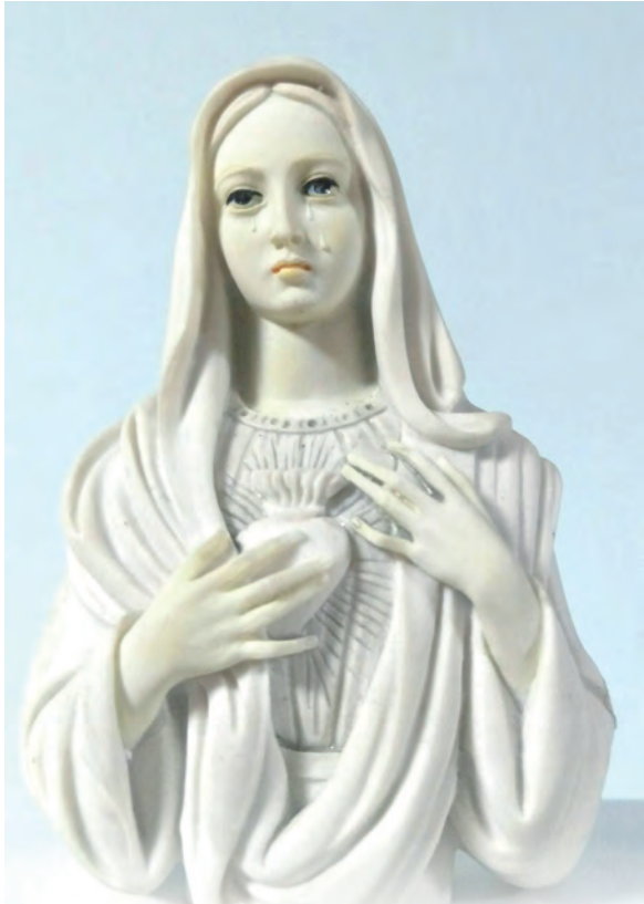
▲落淚的聖母聖心態像，在我的案頭鼓舞我。

在我晉鐸25年滿9個月的日子，我想在這美麗的10月玫瑰聖母月分享我的聖召，我與聖母非常獨特的牽連，非常緊密的關係。