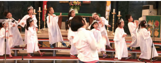
▲文化幼兒園小朋友載歌載舞