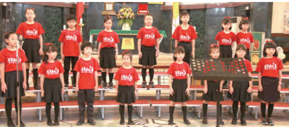
▲低年級組北大小天使合唱團蓄勢待發

比賽尾聲，李主教送給3位辛勞的評審們紀念禮物，並降福在場所有的人。最後全體大合照，集結每一張開心的笑臉，一起為活動畫下美麗的句點。