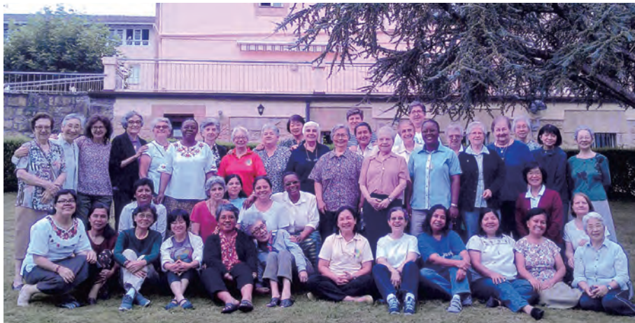
▲仁慈聖母傳教會本屆總會議的代表及服務的姊妹們合影