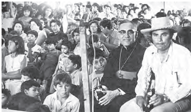
▲在貧苦之人身上與基督相遇