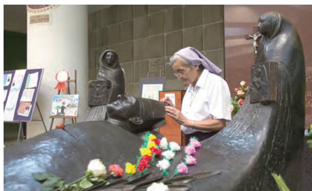
▲聖薩爾瓦多主教座堂內羅梅洛墳墓，雕像四周有4位手持福音的天使環繞，象徵他講道與見證的力量來自於福音。

羅梅洛總主教無畏死亡威脅，非但不退縮，反而善用電台公開傳播天主的道理，宣講正義，也讓在田裡工作的窮人們有機會聽到天主要透過他帶來的訊息。他於1979年7月8日說：「假如有一天他們奪走我們的電台、查封我們的報紙、要我們噤聲、殺光所有神職