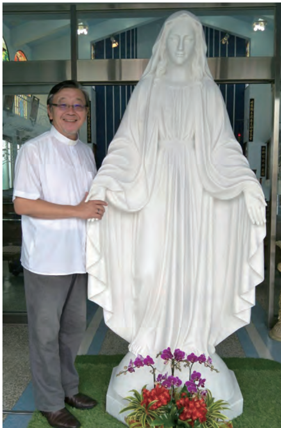
▲這尊遠從越南運回到台南教區大灣天主堂的大理石聖母態像，中間發生許多曲折奇事，讓人深感恩寵滿滿。

發現會卡到門框下緣。之前，我曾量過此門高度為230公分，想說216公分的聖母態像應是可以過得了的；但沒算到底座1.6公分的鋼板及12公分的支架，全部一加起来為229.6公分，僅僅剩餘0.4公分。只能將拖板車的底座稍稍頂起離開地面約0.2公分，才將聖母態像順利就定位。聖母媽媽算得可真準啊！