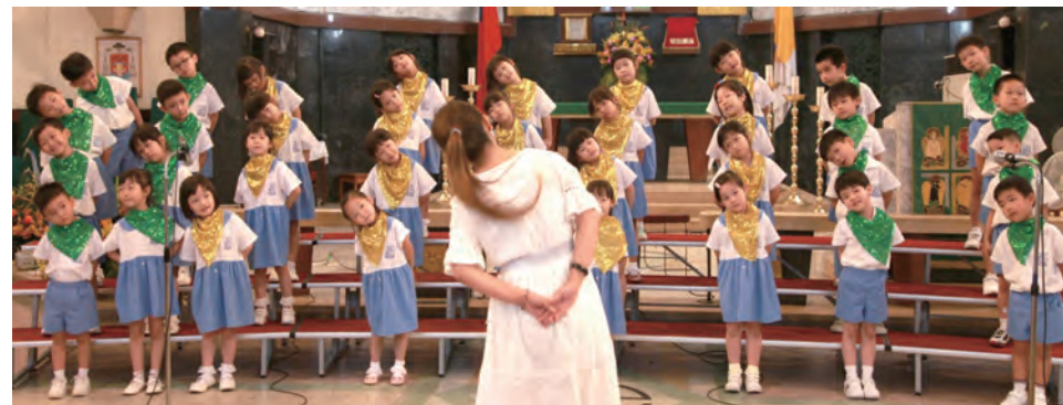
▲活力十足的上智小學幼兒園合唱團