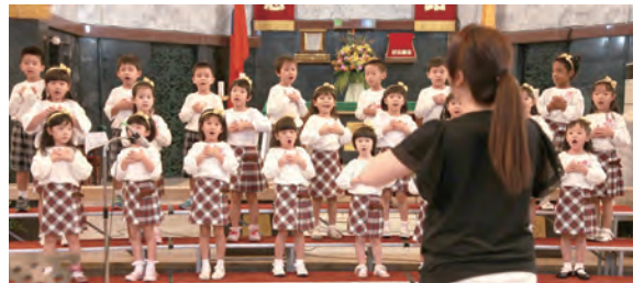
▲聖家幼兒園合唱團因表現出色而勝出