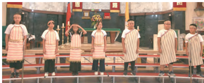
▲高年級組泰雅小孩合唱團原味十足音色清亮