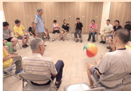
▲志工們與仁啟的大孩子一起歡樂遊戲

在他旁邊；當活動玩得很開心時，他們會緊緊的抱在一起，笑得好燦爛。有一次，因有恩人贈送演藝廳表演的票，我前往欣賞，中場休息時，發現中心的教保老師也帶著這群大孩子來聆聽，我走上前，本以為換了場地、沒穿志工背心，他們可能不認得我，沒想到孩子們竟熱情的向我揮手，讓我備感歡喜。