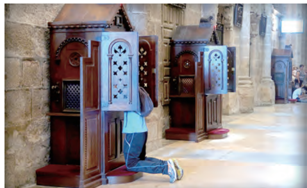
▲聖地牙哥大教堂告解亭

專注及體會〈天主經〉、〈聖母經〉的美和偉大，我求聖母幫助我專注念經及往前進，不必去管腳多痛，更不要理會離前面同伴多遠，那都不重要了。中途，雙腳的巨痛實在無法走動，於是我吃了止痛藥，我知道吃止痛藥其實並不能完全止痛，但足以走下去，藥物減輕一點疼痛再加玫瑰經及新偉神父的陪伴，我以最後一個抵達的成績完成了對我而言是不可能的任務。