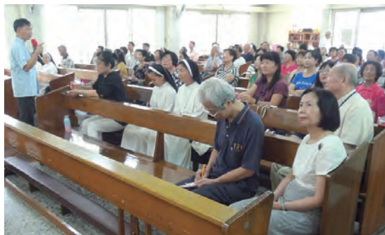
▲9月聖體大敬禮要理講授的聖體要理講授實況 ▶9月聖體大敬禮要理講授，鍾安住主教與講師群及工作人員合影。