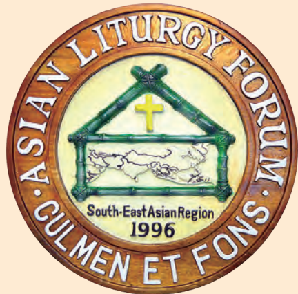
▲第22屆亞洲禮儀論壇LOGO

第22屆「亞洲禮儀論壇」(Asian Liturgy Forum/South-East Asian Region)將於10月中旬在台北舉行。將有來自亞洲各地的會員國代表們熱情參與，主教團禮儀委員會為圓滿辦好此一盛會，早早就做了各項活動規畫，期使與會嘉賓及代表們賓至如歸，豐收滿溢。