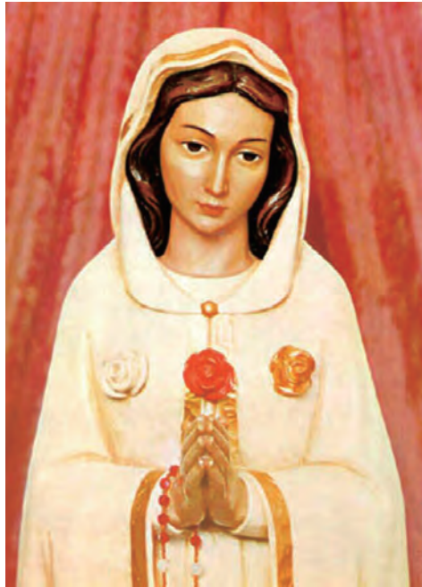
▲玄義玫瑰聖母胸前的3朵玫瑰花都各有代表意涵

1.一日與住嘉義的朋友相約處理事情，但因時間尚未到，就在街上逛逛。經過路邊一間很破舊跳蚤市場，看到有我想要買的中型花盆，就進去參觀。挑好了物