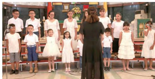
▲主教座堂北大世光隊是個小聯合國

為響應主教團舉辦第1屆全國兒童聖歌歌唱比賽，新竹教區選拔賽於9月16日登場，幼幼組及國小低／高年級組共有10隊報名參加，連同貴賓、指導老師、家長及服務人員近500人歡聚新竹聖母聖心主教座堂，參與這場讚頌上主的音樂饗宴。