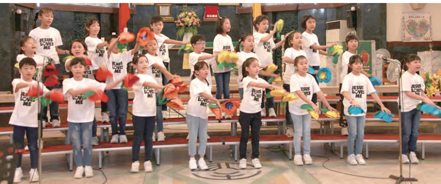
▲低年級組曙光小學合唱團唱作俱佳