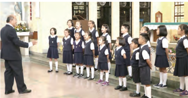
▲彰化天主堂喜樂十字架聖詠團