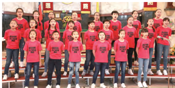
▲高年級組曙光小學合唱團拔得頭籌