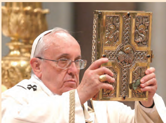
▲第22屆亞洲禮儀論壇的主題是：「聖經與禮儀」。

到禮儀中的音樂，其目的是為了使信友能夠更主動地參與禮儀，以及使禮儀更具團體莊嚴神聖的敬禮形式。因此，《禮儀憲章》第112號要求聖歌應與禮儀的經文，而特別是《聖詠》密切結合，為能「發揮祈禱的韻味，培養和諧一體的精神，和賦予禮儀莊嚴的特性。」